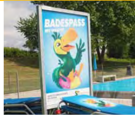
01 Werbefläche F4