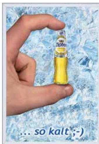
Beispiel 02 / 02