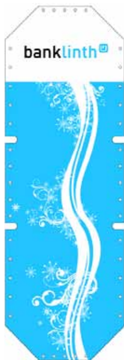
Beispiel 01 / 02