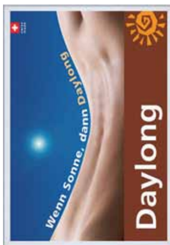
Beispiel 02 / 01