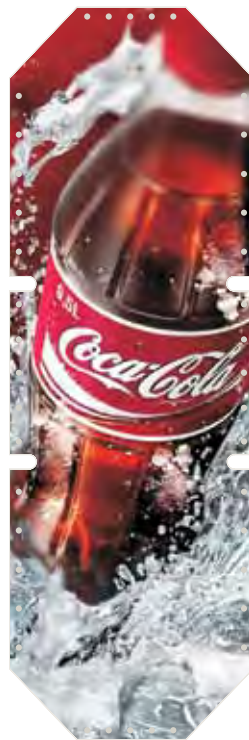
Beispiel 01 / 03