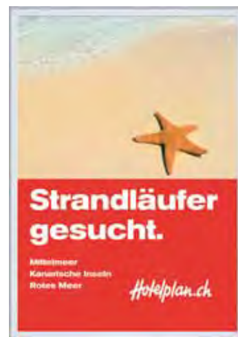
Beispiel 02 / 03