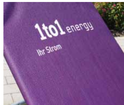
03 Wetterfestes Textil