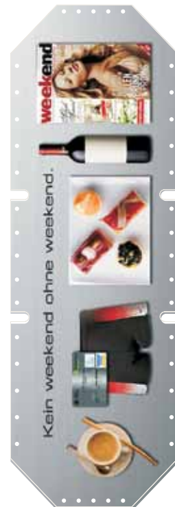
Beispiel 01 / 04